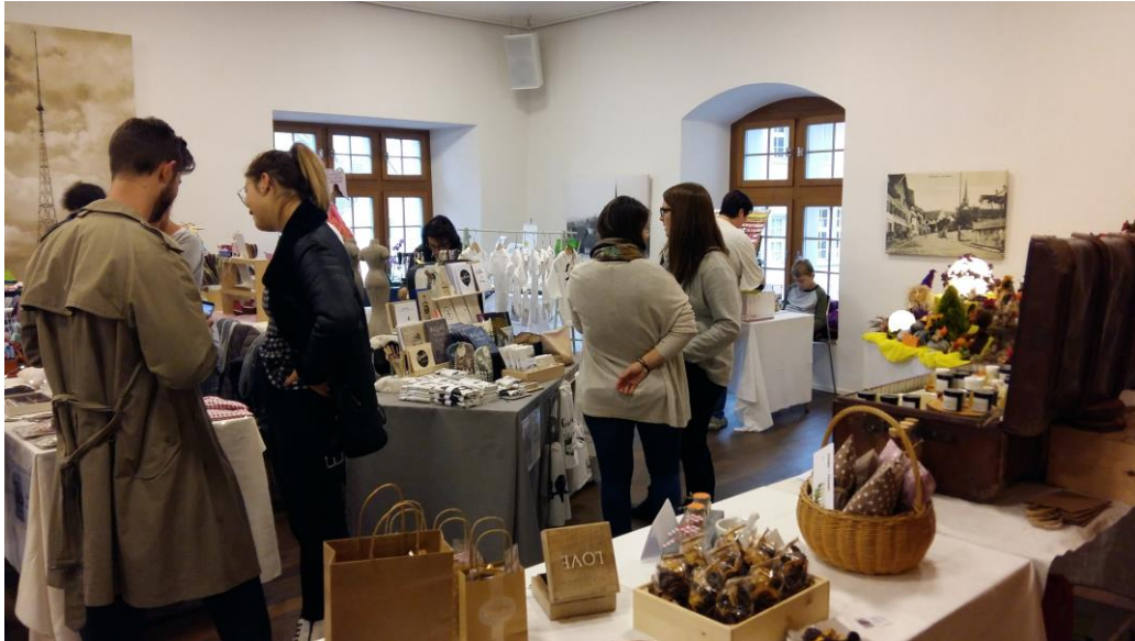
Abb. 6: Handwerker- und Koffermarkt