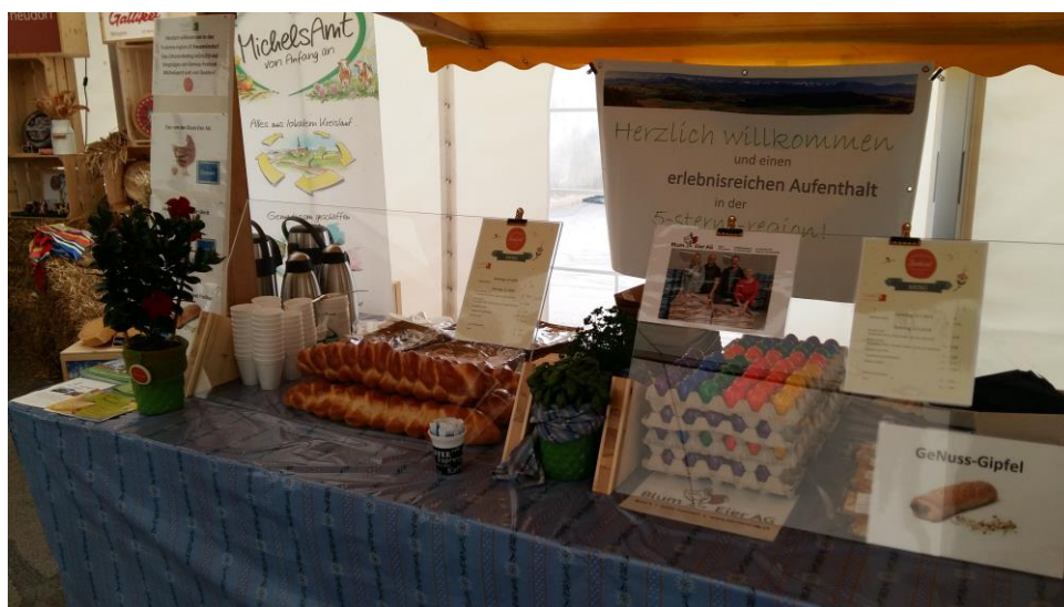
Abb. 3: Brunch-Stand «ortsmarketing beromünster» am Genuss-Festival