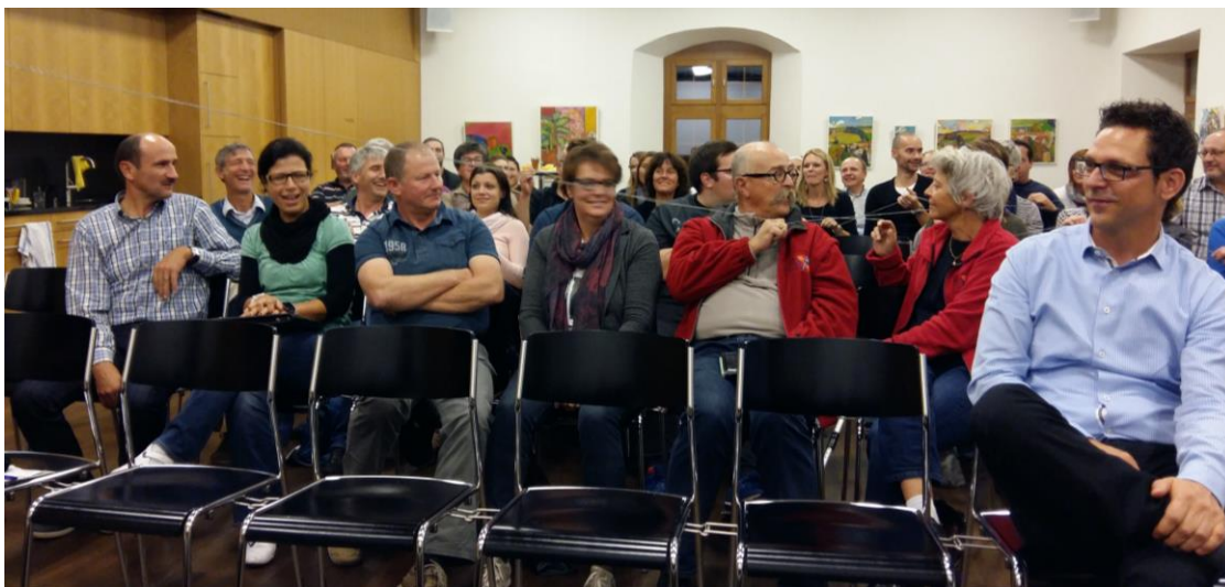
Abb. 2: Vereinspräsidentenkonferenz