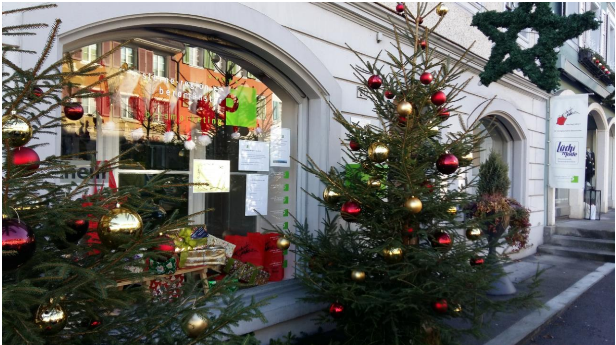
Abb. 4: Geschäftsstelle Fläche 21, Beromünster

Anliegen und Ideen aus der Bevölkerung nimmt das «ortsmarketing beromünster» immer gerne entgegen.